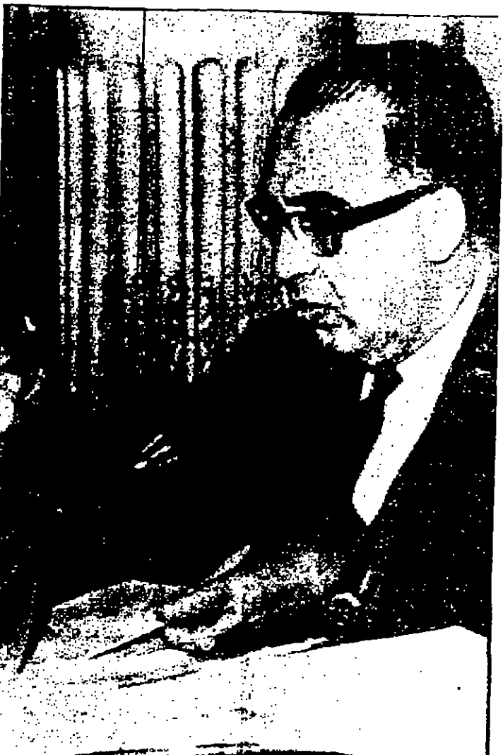
وزير التعليم العالي في الجمهورية العربية المتحدة الدكتور عبد الوهاب البروسي أثناء اجتماع الوزارة مساء الاحد الماضي بعد ان أصدر أمره بوقف الدراسة في الجامعات والمعاهد العليا اثر مظاهرات القصور «مورة اسكافية» خاصة بالمعسر من اليونانيين.

القاهرة - اجتمع السفراء الاجانب في القاهرة امس في جلسة استماع عامة.